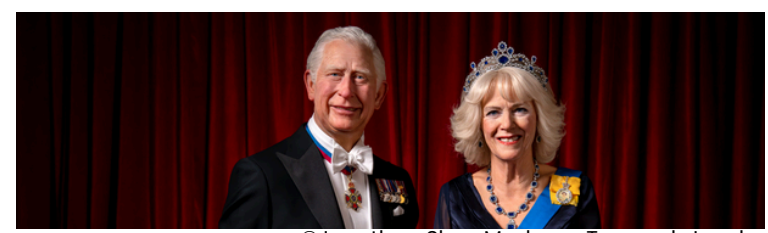
Madame Tussauds London

Conoce a tus celebridades favoritas en este famoso museo de cera. Desde estrellas de cine y músicos hasta figuras históricas y de la realeza, las figuras de cera en Madame Tussauds son increíblemente realistas y ofrecen grandes oportunidades para tomar fotos.